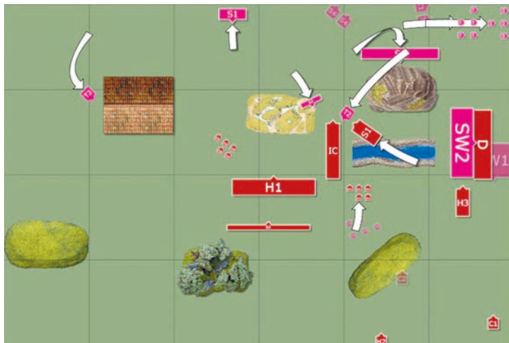
Abb. 5: Taktische Analyse der Bewegungsphase während eines Spielerzuges des Users Princess Sparkle