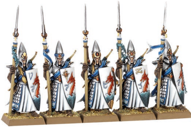
Abb. 6: Fünf bemalte Miniaturen der Kern-Einheit Seegarde von Lothern der Hochelfen (Höhe ca. 2,8 cm)