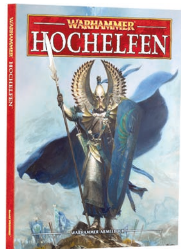
Abb. 2: Vorderdeckel (U1) des Armeebuchs Hochelfen