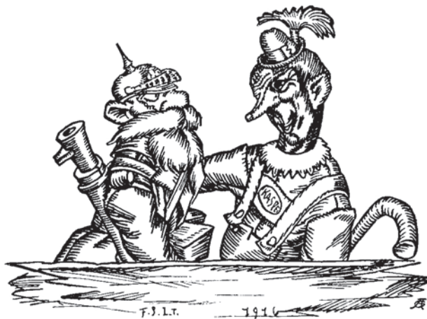
Abb. 2: Szenenbild zu „Die Kasperln und ihre Geheimnisse“ aus F. Oberndorfers Kasperls Kriegsdienst (1917)

Die militärische Praxis wurde gemeinhin bereits im 19. Jahrhundert zu einem „sowohl repräsentativen als auch metaphorischen [...] Symbol Deutschlands“ 63 . In Oberndorfers Kasperls Kriegsdienst trumpft der Deutscher Kasperl in der Szene „Die Kasperln und ihre Geheimnisse“ (Abb. 2) gegenüber dem Östreicher Kasperl mit dem 42-cm-Mörser auf: