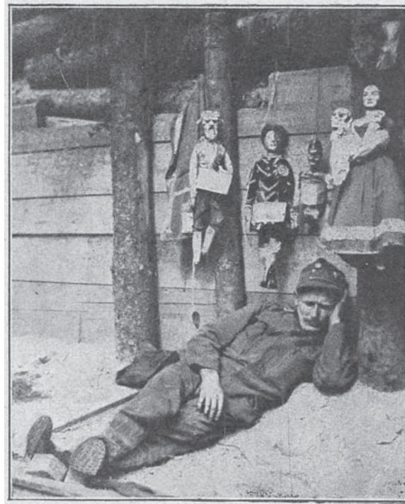
Abb. 1: Ruhepause in einem Kasperltheater in einem Unterstand an der österreichischen Front an der Brenta

Auftrag, 1000 Exemplare von Kasperls Kriegsdienst für das Fronttheater zu drucken; Monate später wurde er aufgefordert, an die Ostfront zu fahren und Soldaten zum Spiel anzuleiten. 39 Ob er dieser Aufforderung tatsächlich Folge leistete, konnte nicht eruiert werden. Mit oder ohne Oberndorfer, der sich übrigens nach Kriegsende als Deutschnationaler präsentierte, 40 trat der Spaßmacher im Ersten Weltkrieg an den Fronten der Donaumonarchie auf (Abb. 1).