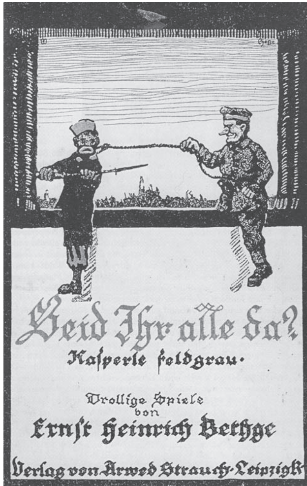
Abb. 3: Titelbild von E.H. Bethge Seid ihr alle da? Kasperle feldgrau (1918)

alle da? Kasperle feldgrau , das aus mehreren Episoden besteht, im Verlauf derer der Kasperl einzelne Stationen eines Soldatenlebens durchläuft, trägt der Spaßmacher eine feldgraue Uniform (dies ist sogar an prominenter Position – am Bucheinband – bildlich festgehalten, Abb. 3).